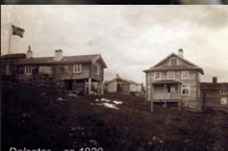
Dalseter - ca 1920