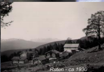
Ruten - ca 1930