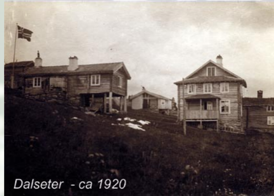
Dalseter - ca 1920

In 1979 werden de oude schuren en stallen door nieuwe gebouwen vervangen. Waar het oude bijhuis stond, werd een nieuw complex met twee appartementen en een garage met werkplaats opgetrokken. Een authentiek houten huis werd bewaard, maar de klokkentoren werd vernieuwd.